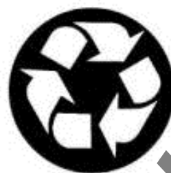
Рисунок ДБ.2 - Примеры изображения знака - «Петля Мёбиуса»

(Приказ МЭР ПМР от 19 апреля 2018 года № 301, газета «Приднестровье» от 25 апреля 2018 года № 72)