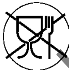
Рисунок 3 для непищевой продукции