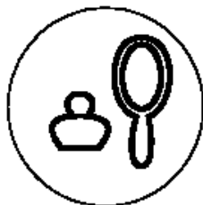
Рисунок 2 для парфюмерно- косметической продукции