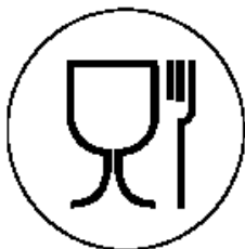
Рисунок 1 для пищевой продукции