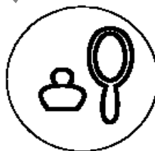
Рисунок 2 для парфюмерно- косметической продукции