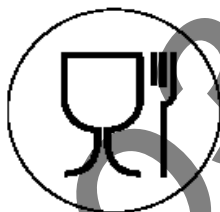
Рисунок 1 для пищевой продукции

ПИКТОГРАММЫ И СИМВОЛЫ, НАНОСИМЫЕ НА МАРКИРОВКУ УПАКОВКИ (УКУПОРЧНЫХ СРЕДСТВ)