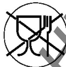
Рисунок 3 для непищевой продукции