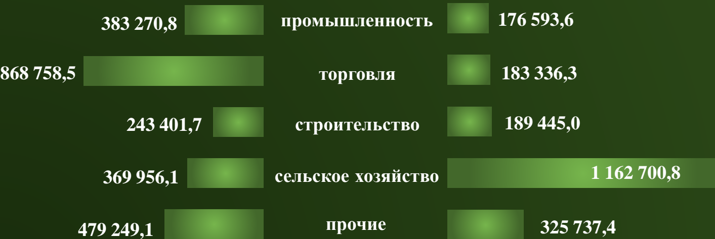
Инвестиции в основной капитал